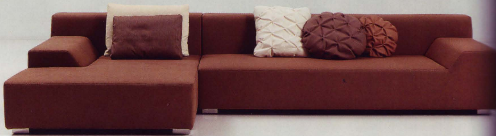
Sancal. Sofá Ace, diseño A-cero <www.sancal.com>