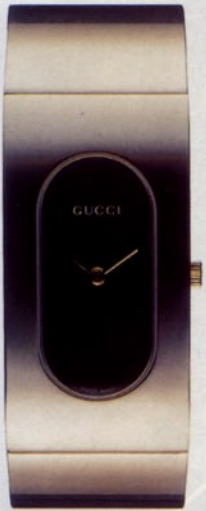
WENIGER IST MEHR Reduzierte Spangenuhr von Gucci Timepieces, aus gebürstetem Edelstahl, mit integriertem Gehäuse, ca. 1690 Mark. Info-Line: 0 63 22/9 43 20