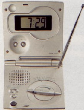
REISEWECKER Jazzy Radio , Paperchase, ca. 110 Mark. Mail-Order: 00 44/1 71/3 23 37 07