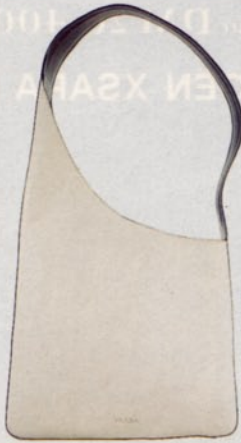
EINFACH PRADA Asymmetrische schwarz-weiße Tasche aus Kalbleder, ca. 1220 Mark. Info-Line: 02 11/16 67 40