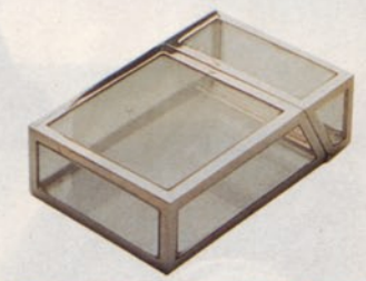
ELEGANTE TRANSPARENZ Silbergefäßtes Zigaretten-etui aus Acryl, Gucci Home Collection, ca. 890 Mark. Info-Line: 0 40/4 50 30 60

FÜR SIE Klares Acryl oder mattes Chrom: dezenate Farben und schlichte Formen für Busineß-Barbies