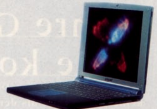
DESIGNER-NOTEBOOK Vaio PCG-5056 von Sony, superdünn, mit vielen innovativen Anschlußmöglichkeiten, u. a. i. LINK-Interface, ca. 6000 Mark. Info-Line: 0 18 0/5 25 25 86