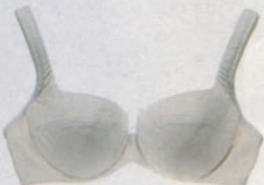
KLARE SACHE Zartgraue Wäsche aus Viskose-Elastic, von Malizia. Slip ca. 70 Mark, BH ca. 135 Mark. Info-Line: 0 89/2 16 34 70