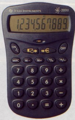
EURO-TASCHENRECHNER E 2000 , von Texas Instruments, ca. 12 Mark. Info-Line: 0 61 96/97 50 15