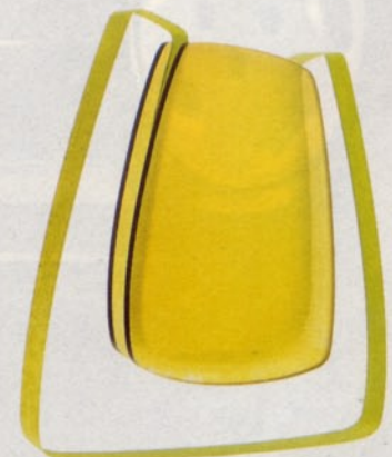
LIEBLINGSVASE aus gelb-grünem Acryl, von Le Page. Space, London, ca. 750 Mark. Mail-Order: 00 44/1 71/2 29 65 33