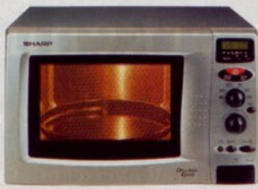
SCHNELLE WELLE Kompakte Doppel-Grill-Mikrowelle in Silber-metallic, mit 18-Liter-Garvolumen, von Sharp, ca. 550 Mark. Info-Line: 0 40/2 36 70