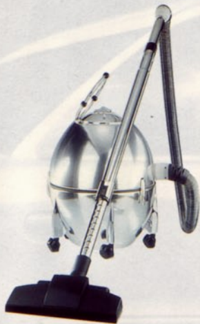
FUTURISTISCH Vacuum Cleaner Apollo 1 , extrem leise, saugt ohne Tüten, ca. 1200 Mark. Über Culinaria, Info-Line: 0 40/5 53 81 54